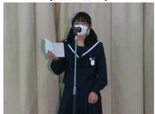
【メッセージの朗読】