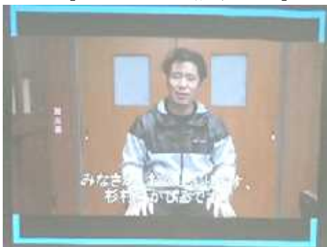
【お世話になった先生からのメッセージ】