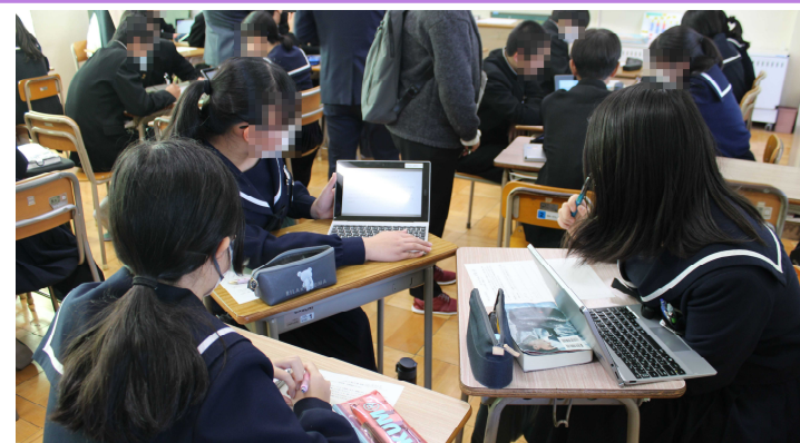
【進捗状況をプレゼンしている2年生の姿】

十一月二十二日（水）に名古屋市立の学校の教職員に向けて、1年生、2年生、特別支援学級の授業を公開しました。